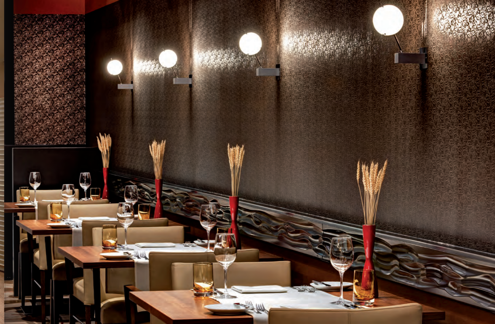
Links: Die Executive Lounge. Oben das Restaurant „RISE“.