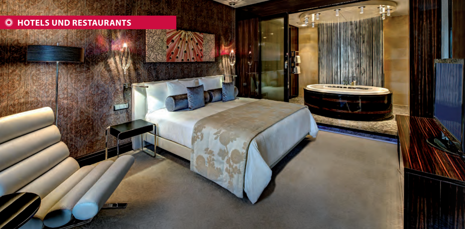
Oben: Das stilvolle Interieur trägt die Handschrift der Hamburger Agentur JOI-Design. Das Hotel wurde kurz nach der Eröffnung 2011 mit dem „Top Hotel Opening Award 2011: Luxus“ ausgezeichnet. Hier: Schlafbereich der Presidential Suite. Rechts: Bild 1: Restaurant „Rise“; Bild 2: Beleuchtungsskulptur „Element“ im Atrium; Bild 3 und 4: „The Fifth“, Lounge & Bar; Bild 5, 6 und 7: Süße Stärkung für die Meeting-Pause.

geschmorten Kirsch-Tomaten und Kartoffelpüree. Ein köstlicher Leckerbissen. Küchenkünstler Manfred Breuer schätzt bei seiner Tätigkeit sehr, dass Teamarbeit und Fortbildungsmaßnahmen gefördert werden. Schmunzelnd hat er uns sein persönliches Lieblingsgericht verraten: Kalbsschnitzel, in Butter gebraten, Bratkartoffeln und Gurkensalat – auch im Restaurant ein heißgeliebter Klassiker.